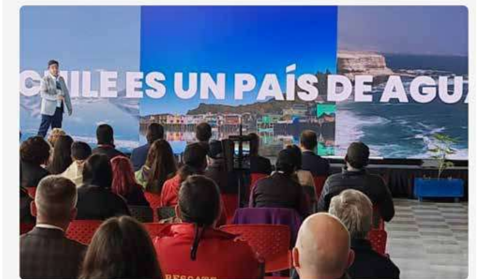
Valparaíso se sumergirá en el océano durante 3 días de festival, con actividades gratuitas en torno a la ciencia, la cultura, la música y el medioambiente. Los dos primeros días se realizarán en el Parque Cultural de Valparaíso, y finalizará en Playa Las Torpederas.

Por segundo año consecutivo se realizará en la ciudad de Valparaíso el Festival Oceánico Acción Azul, este fin de semana del 3, 4 y 5 de noviembre. Por lo mismo, sus organizadores acaban de anunciar su programación completa, para que toda la ciudadanía pueda disfrutar de todas las actividades, que son totalmente gratuitas.