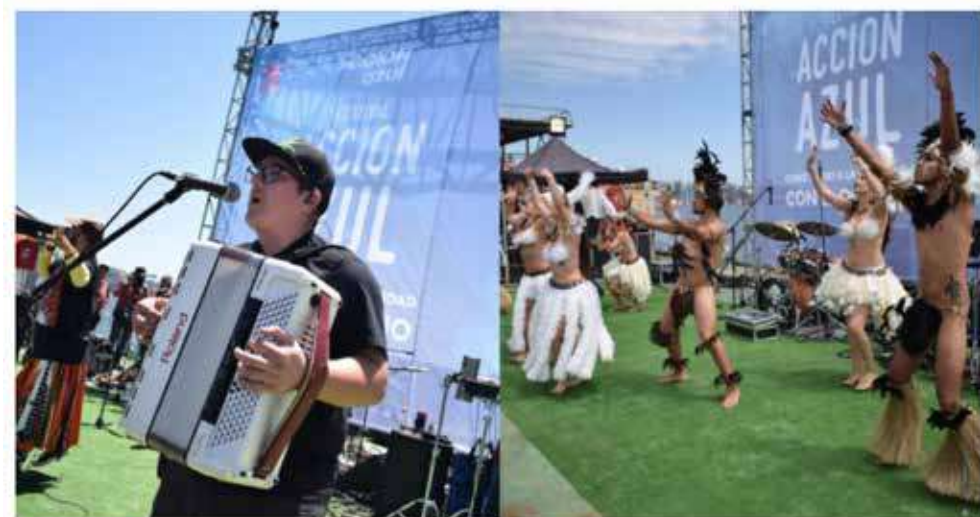
Festival Oceánico Acción Azul