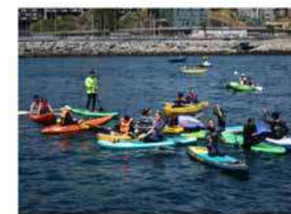
foodtrucks para permanecer en el parque todo el día.

Presencia de la ciencia: Paneles, charlas y exposiciones