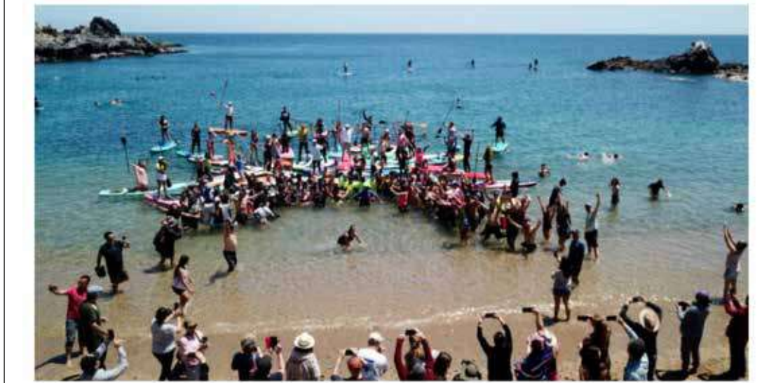
Festival Oceánico Acción Azul